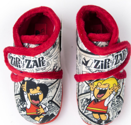
CZZ3 ROJO ESTAMPACIÓN TALLAS: 20-30