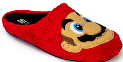
607IV20 ROJO TALLAS: 28-46