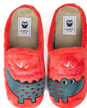
422INV25 MONTBLANC FRESA TALLAS: 36-41