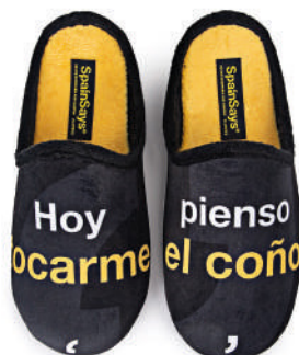
CSP7 TALLAS: 35-47