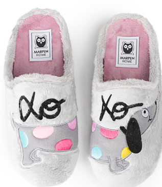
426INV25 MONTBLANC GRIS TALLAS: 36-41