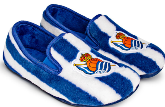
CFA3RS VULCANIZADA 28/47