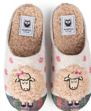
317INV25 CRUDO TALLAS: 36-41