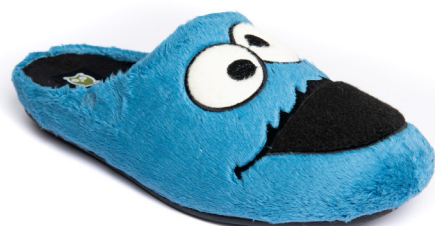
606IV20 AZAFATA TALLAS: 28-46