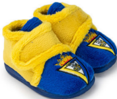
CFACA4 VULCANIZADA 20/30