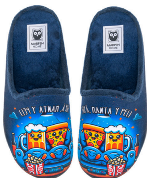
500INV25 MARINO TALLAS: 40-46