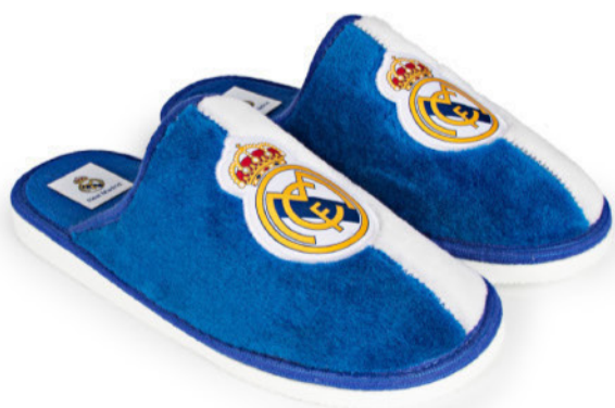
CFRM12 PEGADO 28/47