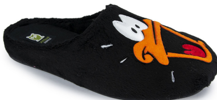
609IV20 NEGRO TALLAS: 28-46