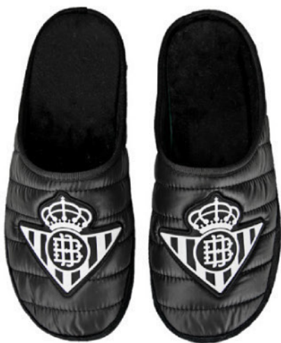
CFA3BE VULCANIZADA 35/46