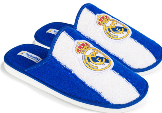
CFRM14 RIZO PEGADO 28/47