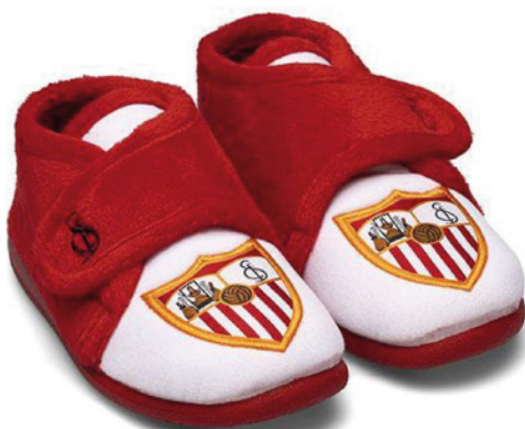
CFA7SE VULCANIZADA 20/30