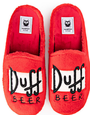
500IV24 ROJO TALLAS: 38-46