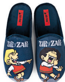
CZZ5 SUATEX ESTAMPACIÓN TALLAS: 30-46