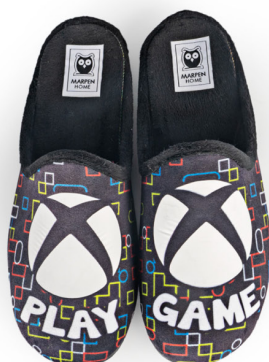
507IV23 TALLAS: 38-46