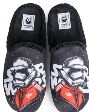
509IV23 NEGRO TALLAS: 38-46