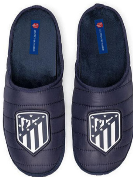
CFA9AT MARINO VULCANIZADA 35/47