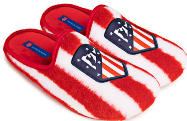
CFA24AT VULCANIZADA 28/47