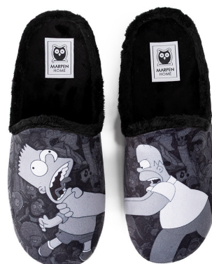
510INV25 NEGRO TALLAS: 35-46