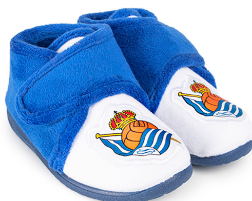
CFA4RS VULCANIZADA 20/30