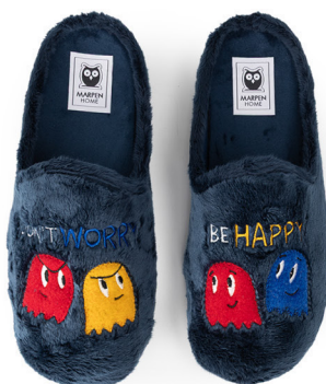
504INV25 MONTBLANC MARINO TALLAS: 40-46