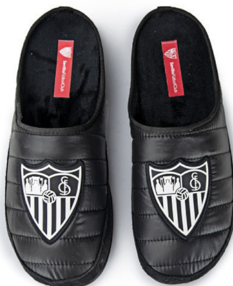
CFA8SE VULCANIZADA 35/47