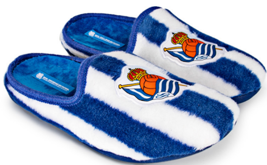
CFA2RS VULCANIZADA 28/47