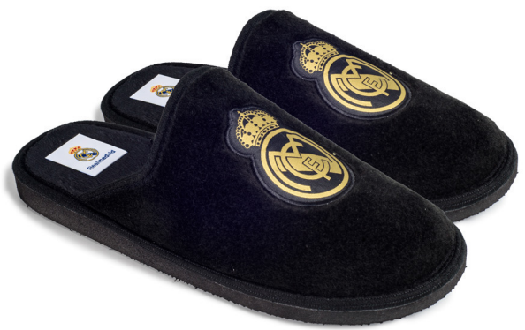
CFRM8 PEGADO 35/47