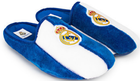
CFRM11 VULCANIZADA 28/47