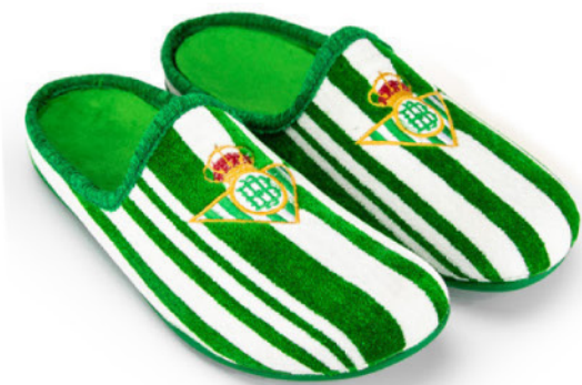
CFA4BE VULCANIZADA 28/46