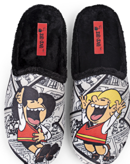
CZZ4 TALLAS: 35-46