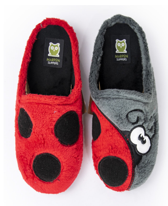
48IV20 TALLAS: 36-41