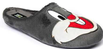
602IV20 GRIS TALLAS: 28-46