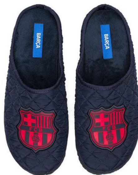
CC4 VULCANIZADA 35/46