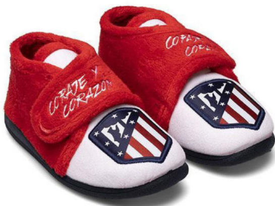
CFA7AT VULCANIZADA 20/30