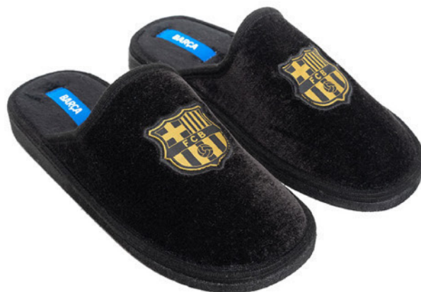
CFA15 PEGADO 28/47