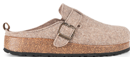
101IV24 MARRÓN TALLAS: 39-47