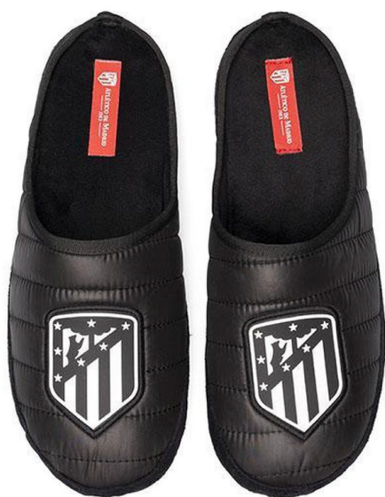
CFA9AT NEGRO VULCANIZADA 35/47