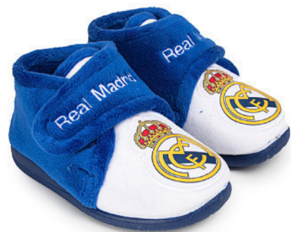
CFRM4 VULCANIZADA 20/30