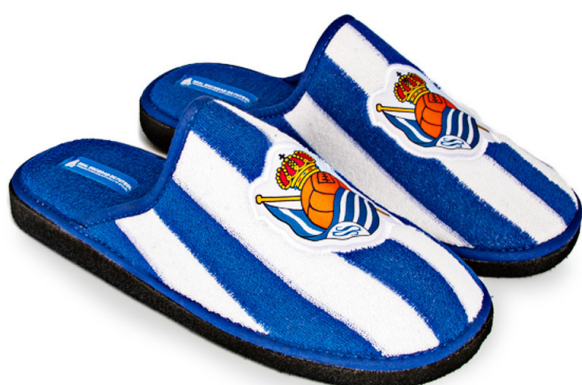
CFA5RS PEGADO 28/47