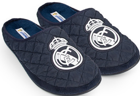
CFRM3 VULCANIZADA 35/47