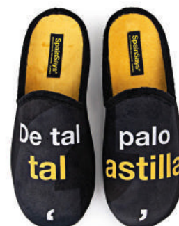
CSP8 TALLAS: 35-47