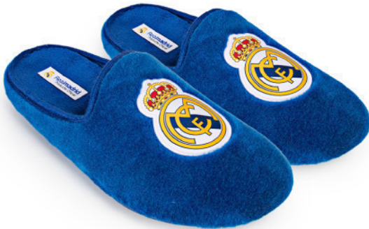
CFRM5 VULCANIZADA 28/47