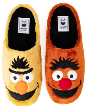
600INV25 COMBINADO TALLAS: 35-46