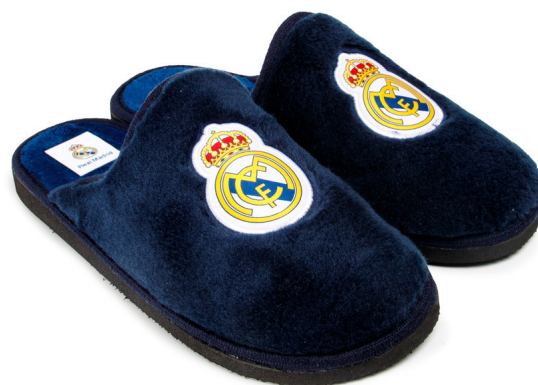
CFRM18 PEGADO 28/47