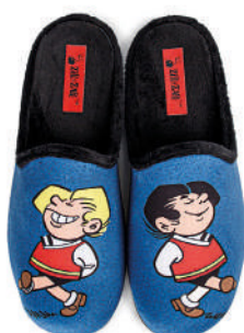
CZZ7 TALLAS: 39-46