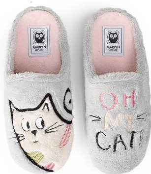
425INV25 MONTBLANC GRIS TALLAS: 36-41