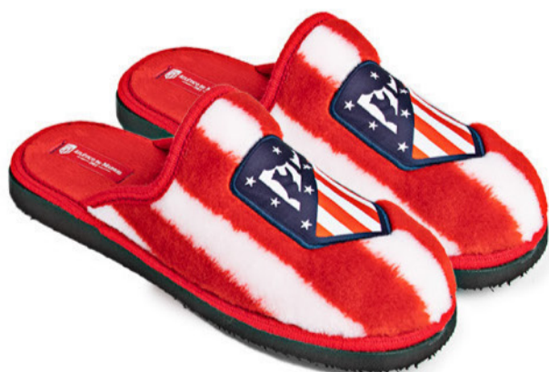
CFA23AT PEGADO 35/47