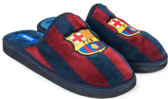
CFA4R PEGADO 28/47