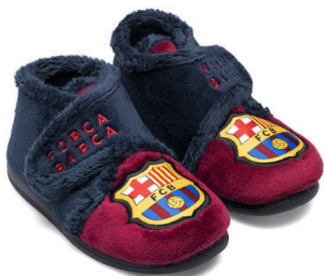
CPC5 VULCANIZADA 20/30