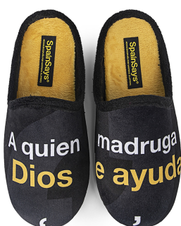
CSP6 TALLAS: 35-47