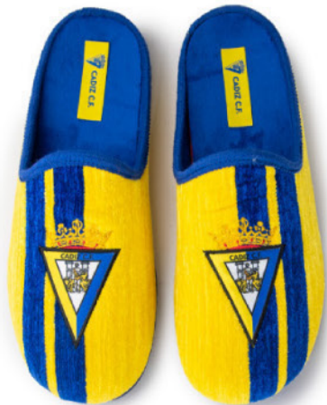
CFACA1 VULCANIZADA 28/46