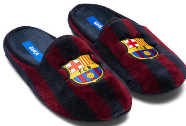
CFA1 VULCANIZADA 28/47