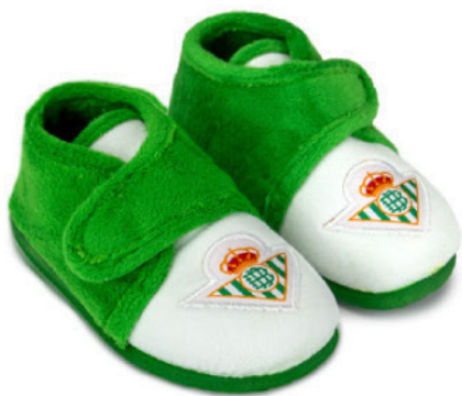
CFA7BE VULCANIZADA 20/30