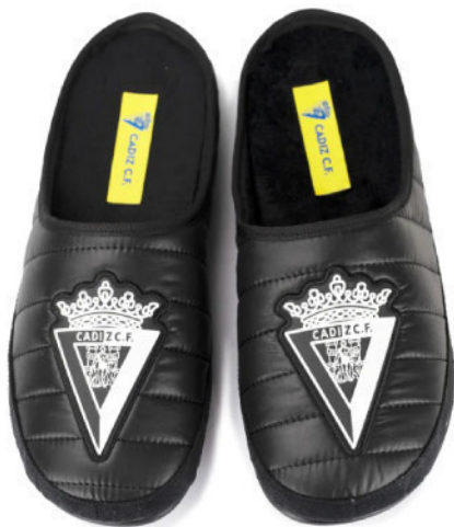
CFACA3 VULCANIZADA 38/46