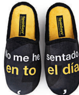
CSP5 TALLAS: 35-47