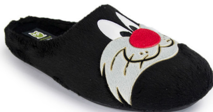
601IV20 NEGRO TALLAS: 28-46