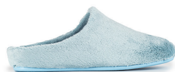
603IV23 AZUL TALLAS: 36-41