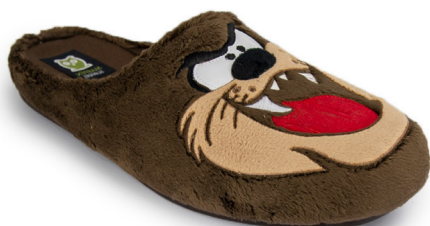
603IV20 MARRÓN TALLAS: 28-46