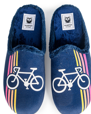
511INV23 MARINO TALLAS: 38-46