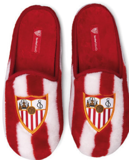
CFA3SE VULCANIZADA 28/46