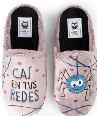
404INV25 LILA TALLAS: 36-41