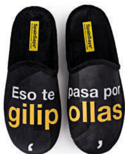
CSP1 TALLAS: 35-47