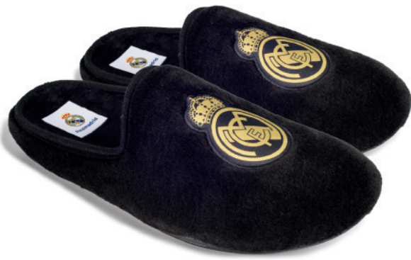
CFRM7 VULCANIZADO 35/47