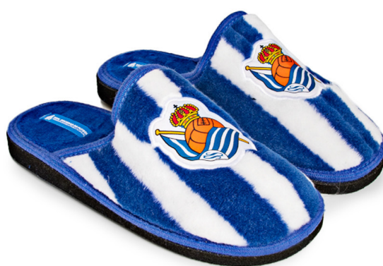
CFA1RS PEGADO 28/47