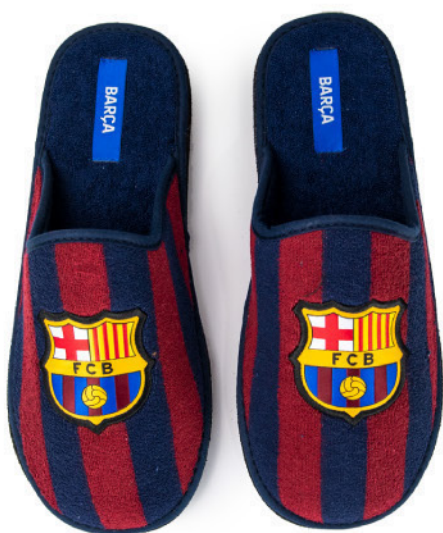
CFA17 PEGADO 28/47