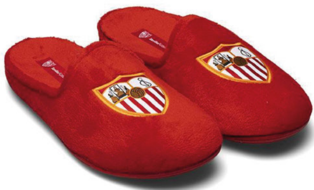
CFA5SE VULCANIZADA 28/47