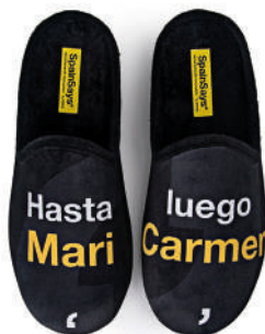
CSP2 TALLAS: 35-47